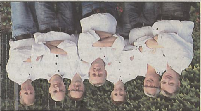
SEK (das musikalische SonderEinsatzKommando) der Wetteraler.