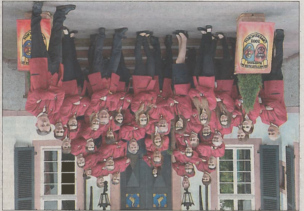
Stammorchester der Wetteraler Blasmusik.