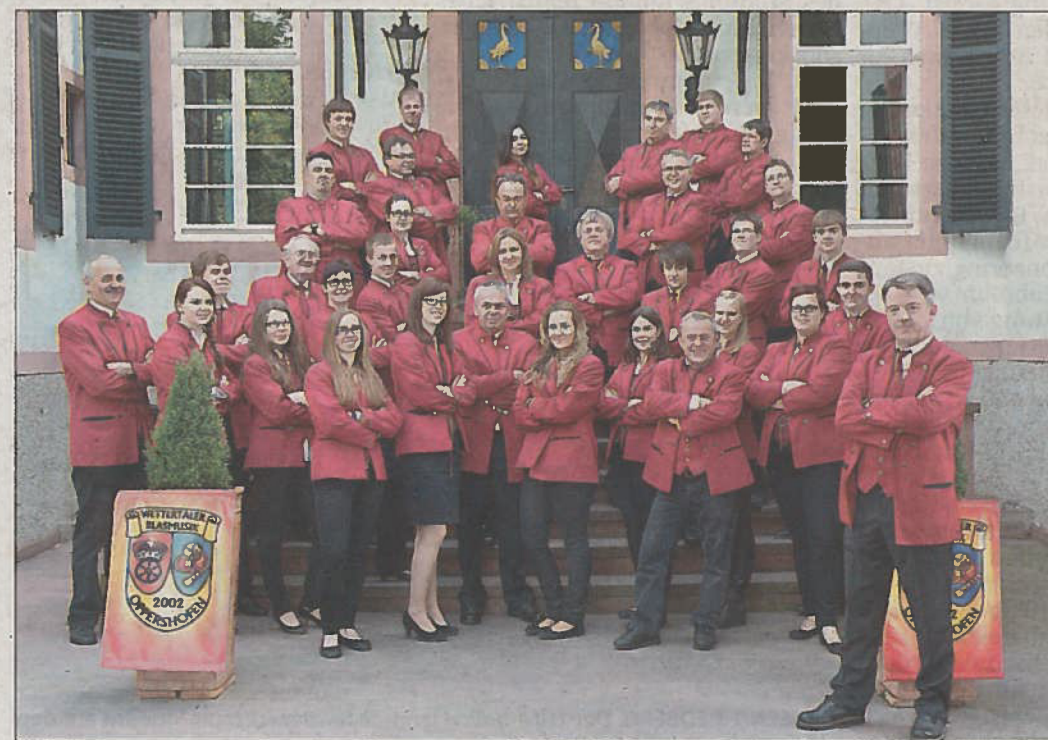
Stammorchester der Wettertaler Blasmusik.