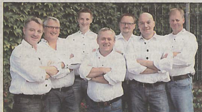
SEK (das musikalische SonderEinsatzKommando) der Wettertaler.

Um ein Haar hätte die Oppershofener Kirmes das Zeitliche gesegnet, nachdem sich in den letzten Jahren herausstellte, dass die bisherigen Vereins-Partnerschaften nach und nach ausliefen. Doch dank des Engagements des WSV Oppershofen, der SG Oppershofen und der Wettertaler Blasmusik geht die Oppershofener Kirmes-Tradition weiter, wenn